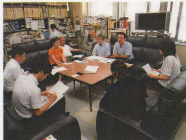
▲影響調査を発表する民商・北商連の代表

民商・北商連では、引き続き実態調査を行いながら、国会要請や自治体交渉の資料として活用していく予定です。