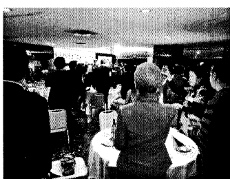
▲多くの参加で盛り上がる