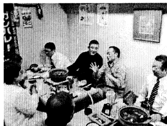
▲南区支部総会の様子