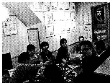
▲第2支部懇親会の様子