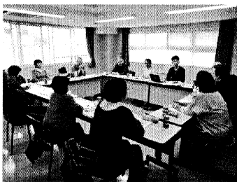
▲分散会で活発に発言

後半の全体会では、河井北部民商会長から「秋の運動終盤に向けて、仲間増やして札幌全体を前進させよう」と決意表明しました。