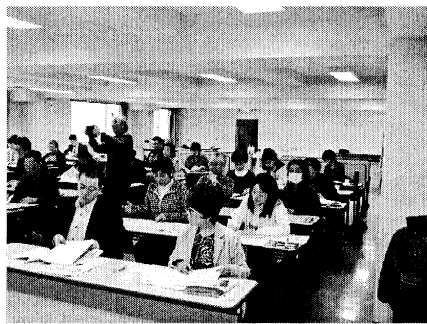
▲学習会に参加した中部民商役員

札幌社保協の斉藤事務局長は「今の社会保障は、自助(自分で頑張れ)↓共助(周りも助けろ)↓公助(じゃあ国が面倒みるか)の流れになっている。これでは真の社会保障ではない。消費税を導入・増税しても社会保障は改悪されてきた」と強調しました。そのうえで、「中小業者・労働者・高齢者等あらゆる階層で怒りの声をあげ、国や行政に直接モノ申す行動を」と提起しました。