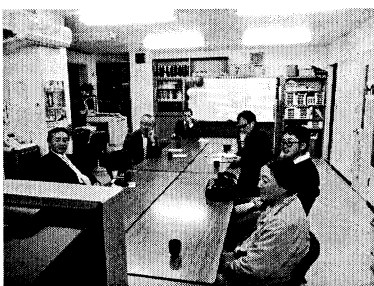
▲ようこそ民商へDVDを見ながら

今年の4月以降に入会した新会員を対象に支部長名で招待状を送り、各支部で電話かけを行いながら参加を呼びかけました。ほとんどが仕事等と重なって参加できませんでしたが、「機会があったら参加したい」等、今後につながる対話にもなりました。