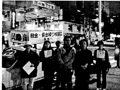
▲宣伝行動に参加した役員の皆さん

今回の行動に際して、第2支部では昨年の取り組みをひきまえて、宣伝方法や宣伝グッズ等について論議を重ねてきました。合わせて、狸小路の店舗の変化を掴もうと実地調査も行ってきました。前回は続き、事前にDMを発送。9月12日(木)には、役員・事務局で店舗数を確認しながら、事前の宣伝行動も行い、50件に直接資料を渡してきました。