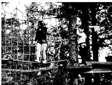
▲ツリートレッキングを楽しむ

1日(日)に行われた共済会レクリエーションは50人が参加。今回は、自然体験型の企画で、ニセコヒレツジの「ピュア」へ向かいました。前日までは雨が降り続け、当日の天候も心配でしたが、雨も降らず、参加者は様々なアクティビティを楽しみました。