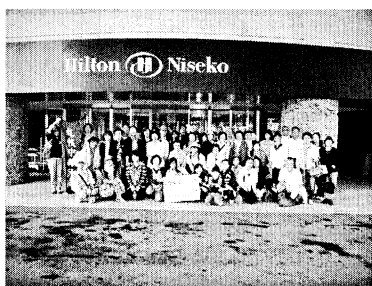
▲天候にも恵まれたレク

HPをリニューアルし、ブログも開設しました。各支部・班での取り組み等、どんどん書き込んでください。 HPアドレス http://www.tyu-min.com/ 活動ブログ http://blog.livedoor.jp/sapporotyumin/