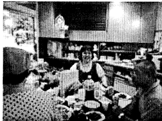
▲暑い日にはビールが一番！と自然と顔もほころぶ