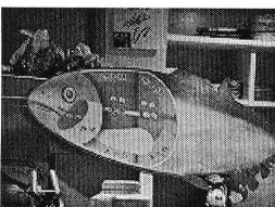
▲まぐろ屋さんの紹介は中部民商HPIにも掲載されています

定休日の木曜日しか自由がききませんので、皆様にご迷惑をおかけすると思いますが何卒いろいろご協力、ご指導下さいますようお願い申し上げます!