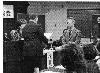
▲横江前会長へ感謝状と記念品を贈呈

*支部の横の「新」は新役員です *常任理事・理事・会計監査は次回のニュースで紹介します