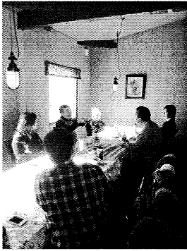
▲盛り上がった南区支部交流会

南区支部では「会員のお店でランチを食べながら語り合おう」とランチ交流会を企画し、7人が参加しました。確定申告学習会に参加した他の支部からも参加してワイワイ盛り上がり、あっという間に時間が過ぎました。