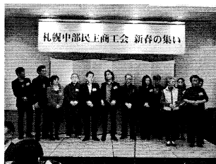
▲支部毎に自己紹介 (写真はススキノ支部)

今年は参加した会員が支部毎に壇上に上がり、自分のお店や商売をアピール。 最初は出るのを渋っていた会員も、上がってみると堂々とお店や商売のアピールをしながら、自己紹介をしていました。