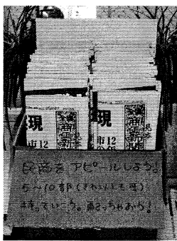
▲民商紹介資料グッズ

総会方針案では、業者の実態調査アンケートで目標を大きく上回る106人分を集めた。道庁の集約数になった事を報告。部員訪問でも多くの部員から歓迎の声を寄せられ、お礼を言わ