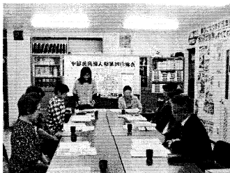
▲活発な議論を行った婦人部総会