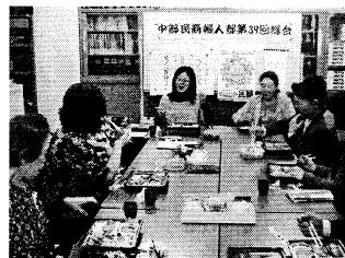
▲懇親会では和やかに懇談

れ嬉しかった」と述べました。引き続き部員訪問を進めながら、魅力的な婦人部にしていくと提起しました。 総会後は昼食を食べながら、役員・部員で「和やかに懇談・交流しました。」