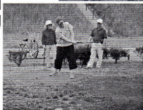
▲パークゴルフで親睦を深めた参加者の皆さん