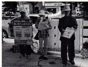
▲消費税廃止中央区各界連の 宣伝行動(6月12日)

消費税は、売上に課税される税金で、赤字でも納めなければなりません。多くの中小業者は価格に消費税を転嫁できず、身銭を切って納めています。「今でもやっこの思いで払っているのに10%になったら払えない」「私たちに商売やめろ」と言うのか」と多くの会員からも怒りの声が出されています。