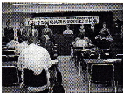
▲今総会で選出された新役員

中部民商共済会第29回定期総会が22日(日)に開かれました。総会では、一年間の活動を総括しながら、全会員対象の大腸がん検診の取り組み、保険業法見直しの運動について報告しました。方針案・財政報告を全会一致で承認し、新役員を選出しました。