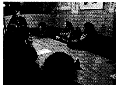
▲会員同士の絆を強めようと話し合った第1支部総会